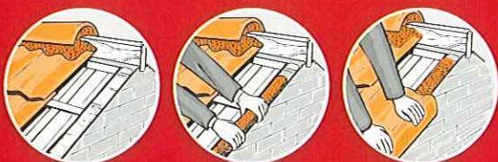
Lægning og fastgørelse af vindskedesten