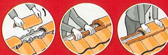
Fastgørelse af rygningsten og vindskedesten