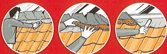
Reparation af revnet blyinddækning